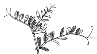
カラスノエンドウ